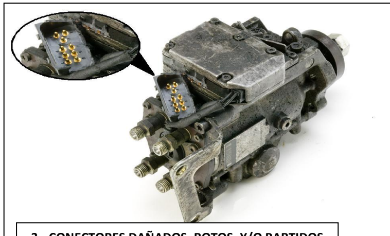
3.- CONECTORES DAÑADOS, ROTOS, Y/O PARTIDOS