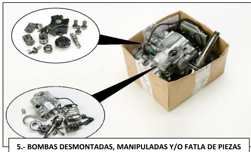
5.- BOMBAS DESMONTADAS, MANIPULADAS Y/O FATLA DE PIEZAS