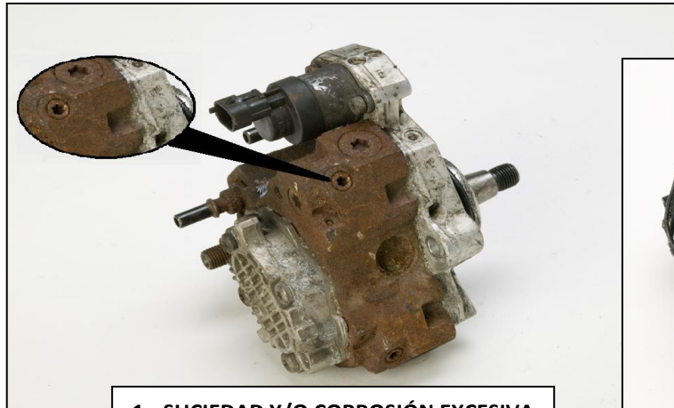
1.- SUCIEDAD Y/O CORROSIÓN EXCESIVA