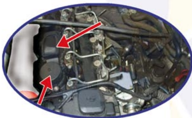
UBICACIÓN EN EL MOTOR

No se admitirá ningún turbo en garantía que presente los síntomas de no haber sustituido dicho filtro.