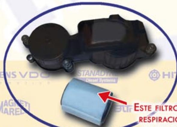
ESTE FILTRO DE EL RESPIRACIÓN DE MOTOR NECESITA SER SUSTITUIDO.